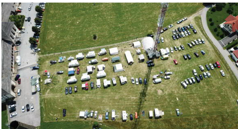
2019 findet zum 32. Mal dieses größte steirische Treffen der Funkamateure statt

InfoPoint des ÖVSV Landesverband Steiermark direkt neben dem Antennenhaus/Antennenmasten auf der Wiese: Hier gibt es Informationen über den Amateurfunk und die